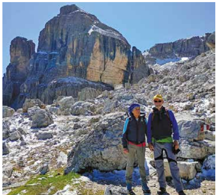
Verso il rifugio Pisciadù, gruppo del Sella