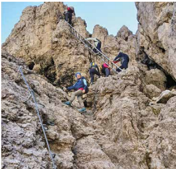
Sentiero attrezzato verso il Pisciadù