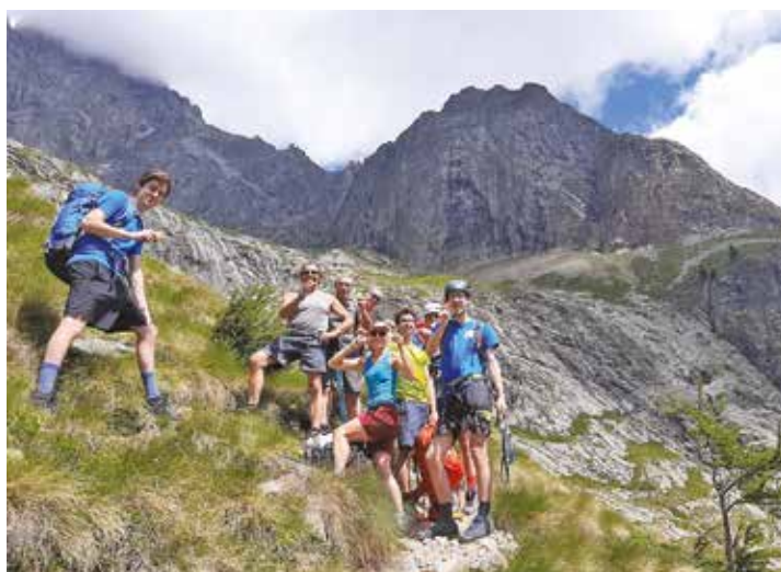
Uscita sociale al Rifugio Zamboni Zappa (Alagna)

“ Come ogni anno a luglio, si sale al Borelli. C'è sempre qualcuno che si aggrega per la prima volta ma per tanti ormai è diventata una tradizione. Tutti vengono catturati dalla magia di quel posto incastro tra le rocce del Monte Bianco! ”